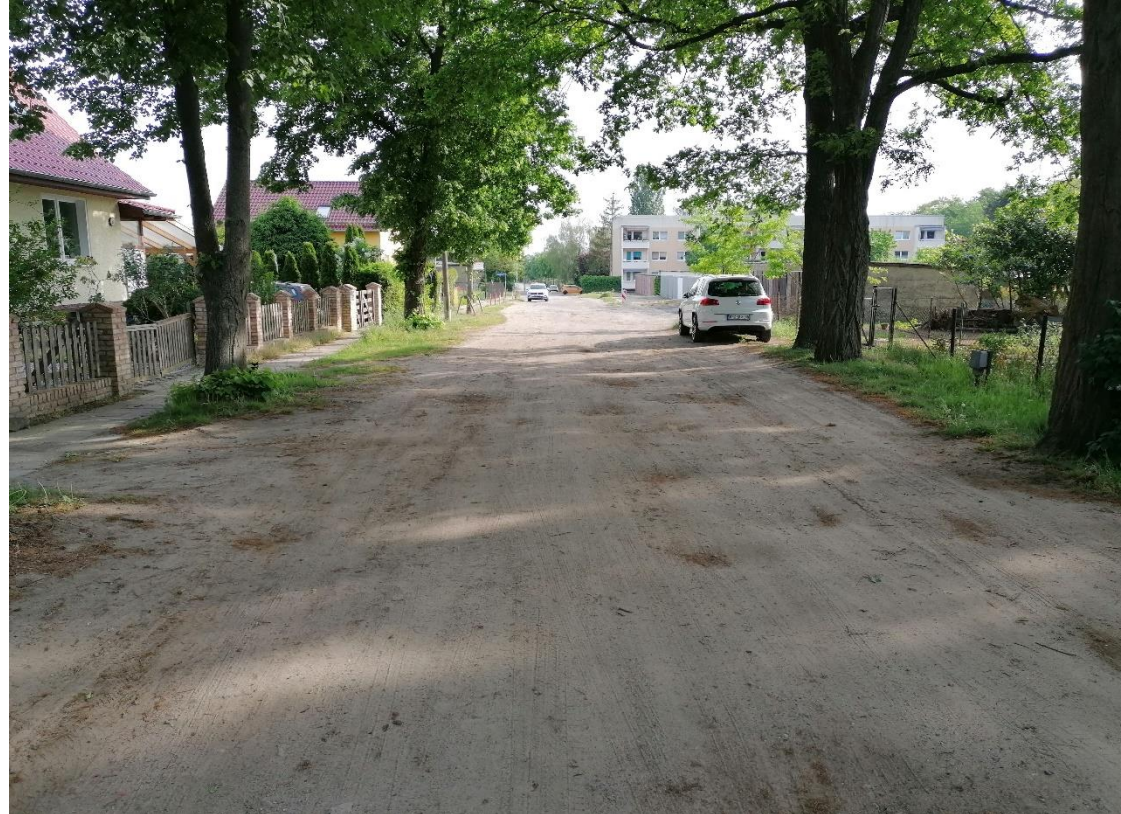
Abbildung 3: Sputendorfer Straße, Blickrichtung Nord