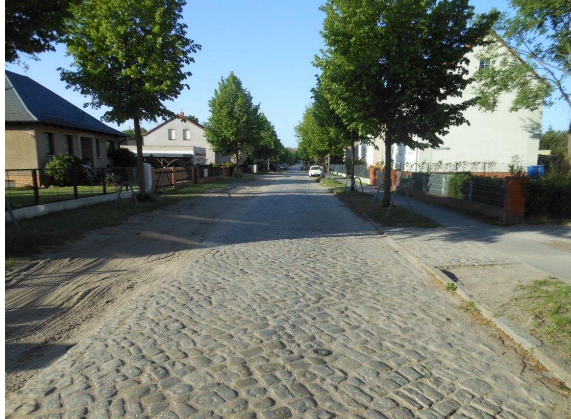
Abbildung 2: Sputendorfer Straße, Blickrichtung Süd