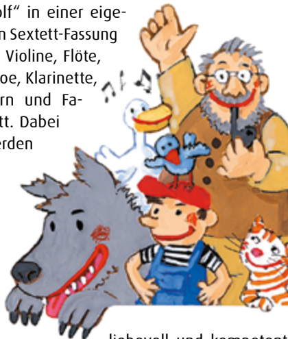
Illustration Tanja Szekey

Das Bläserquintett des Kammerorchesters Unter den Linden zusammen mit Julia Jahnke-Kähler (Violine) spielt am Sonntag, 15. Oktober 2023, ab 16 Uhr im Stubenrauchsaal Sergej Prokofjews Klassiker „Peter und der Wolf“ in einer eigenen Sextett-Fassung für Violine, Flöte, Oboe, Klarinette, Horn und Fagott. Dabei werden